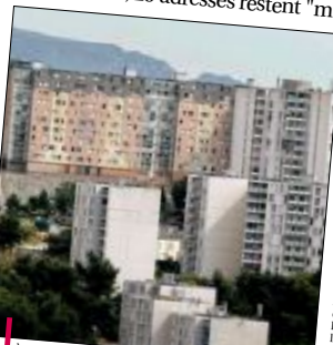
À Marseille, où des milliers de familles sont mal logées (voire pas logées du tout), deux bâtiments publics pourraient être mis à disposition.

D'après le ministère, 29 immeubles et 330 logements seraient mobilisables.